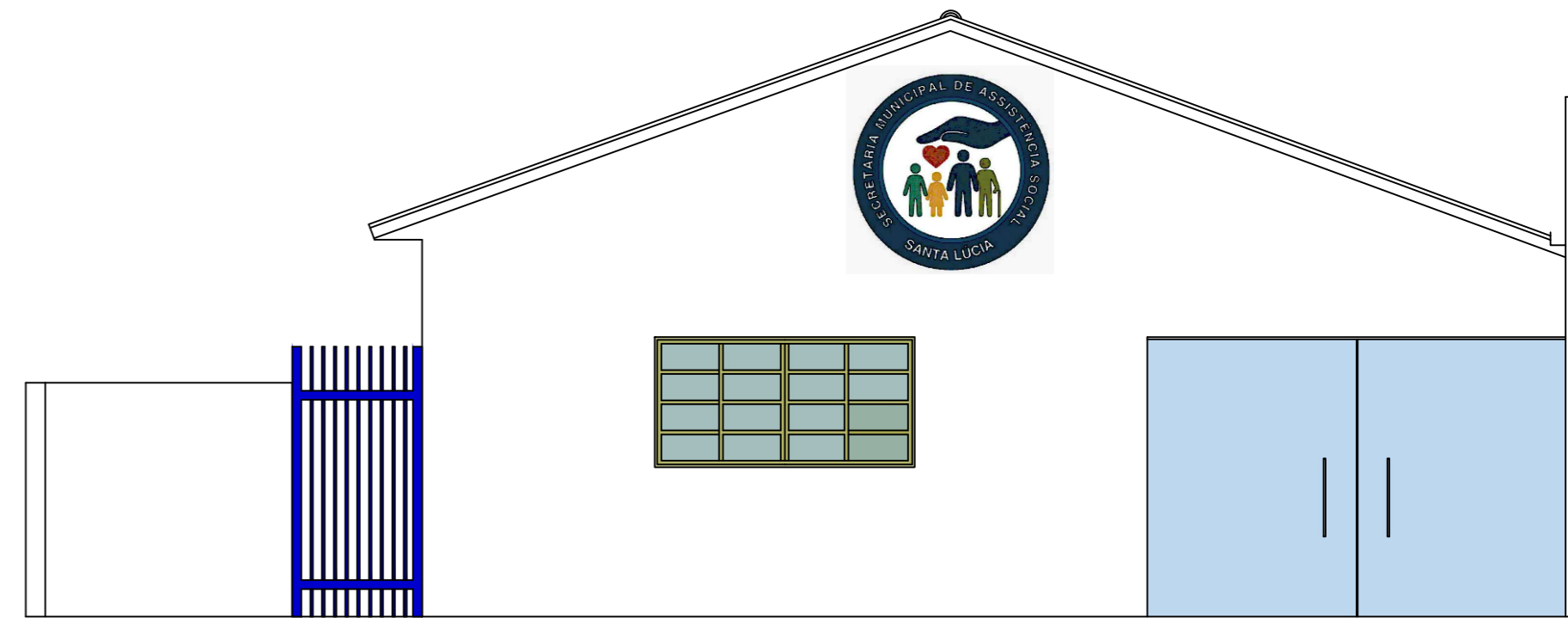
03 FACHADA ESCALA 1:50